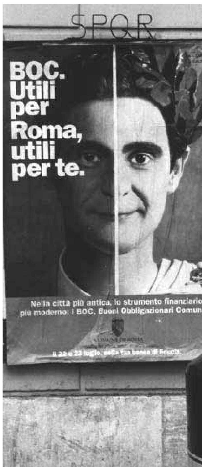
Il manifesto che pubblicizza i Boc

Vacanze romane, ma con gatti e cani al seguito. Da quest'anno, i turisti in visita nella Capitale non avranno più il problema di lasciare a casa i propri animali, affidati a pensioni, ad amici o parenti: tredici alberghi cittadini, infatti, hanno già aderito alla richiesta dell'Ufficio diritti animali del Comune e dell'assessore al turismo Francesco Carducci di ospitare, oltre ai clienti, anche i piccoli «quattro zampe». Per il momento, però, si tratta solo di grandi hotel di prima categoria: l'Atlante e il Ritz, il Plaza, l'Hotel Cicerone e l'Eden, il Quirinale e il Raphael, il Rex, il Midas, Le Grand Hotel e il Princess, il Cavalieri Hilton e lo Sheraton. In tutti gli alberghi che aderiscono all'iniziativa, poi, a cani e gatti sarà servita anche la prima colazione. E, a partire dalle prossime settimane agli animali accompagnati dai loro padroni avranno accesso anche al ristorante. Ma le iniziative dell'Uda non si fermano qui. Per agevolare i romani che non sanno a chi affidare i propri beniamini per le vacanze, l'ufficio diretto da Monica Cirinna ha istituito un servizio di «scambio alla pari»: chi parte a luglio, ad esempio, può lasciare il suo gatto a chi invece resta in città, ricambiandogli il favore il mese successivo. Per informazioni si può telefonare al 67103149.