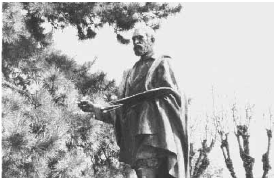
Il monumento a Giovanni Battista Moroni ad Albino

Schivo e sedentario, i suoi percorsi sono assai limitati: Bergamo, Brescia, Trento, punto e basta. Neppure a Venezia volle recarsi, e si che allora Venezia era una grande capitale dell'arte. Avrebbe potuto conoscere persi-