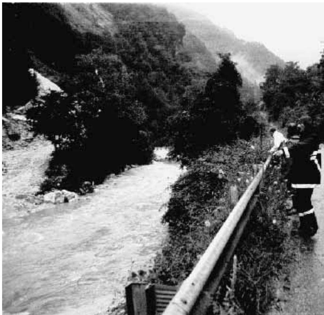
Vigili del fuoco controllano l'argine del fiume Serra in alta Versilia