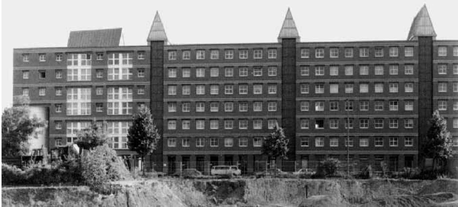
Friedrichstadt, edificio per abitazioni di Aldo Rossi