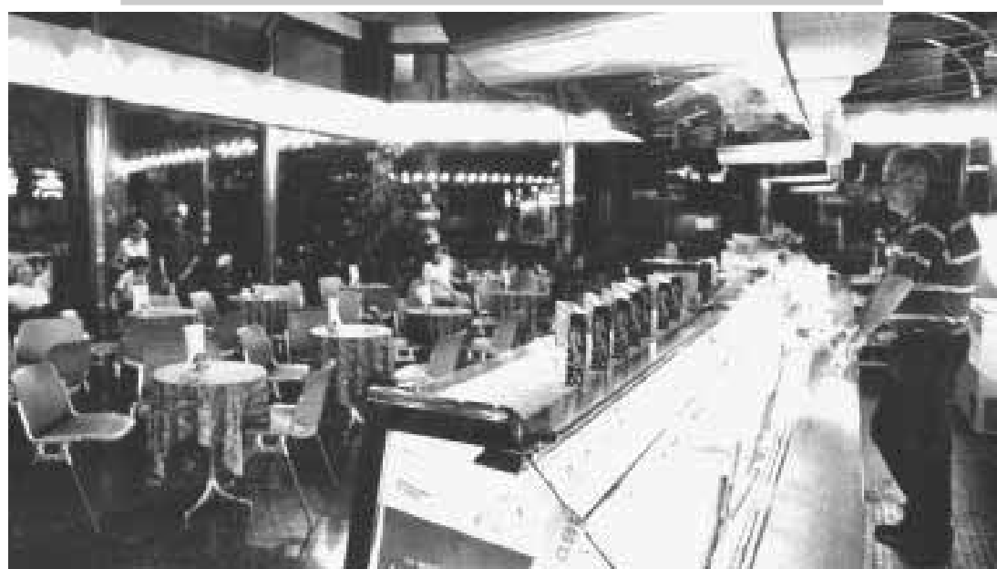
L'interno della gelateria Grasso in viale Doria 17