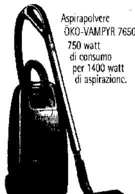
Aspirapolvere ÖKO-VAMPYR 7650 750 watt di consumo per 1400 watt di aspirazione.