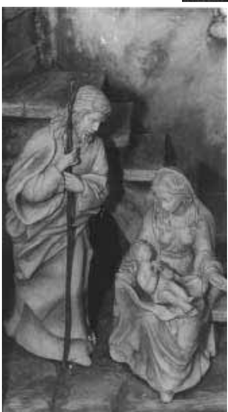
San Giuseppe rappresentato in un presepe. a destra, Giovanni Paolo II all'udienza di ieri nell'aula Paolo VI in Vaticano.