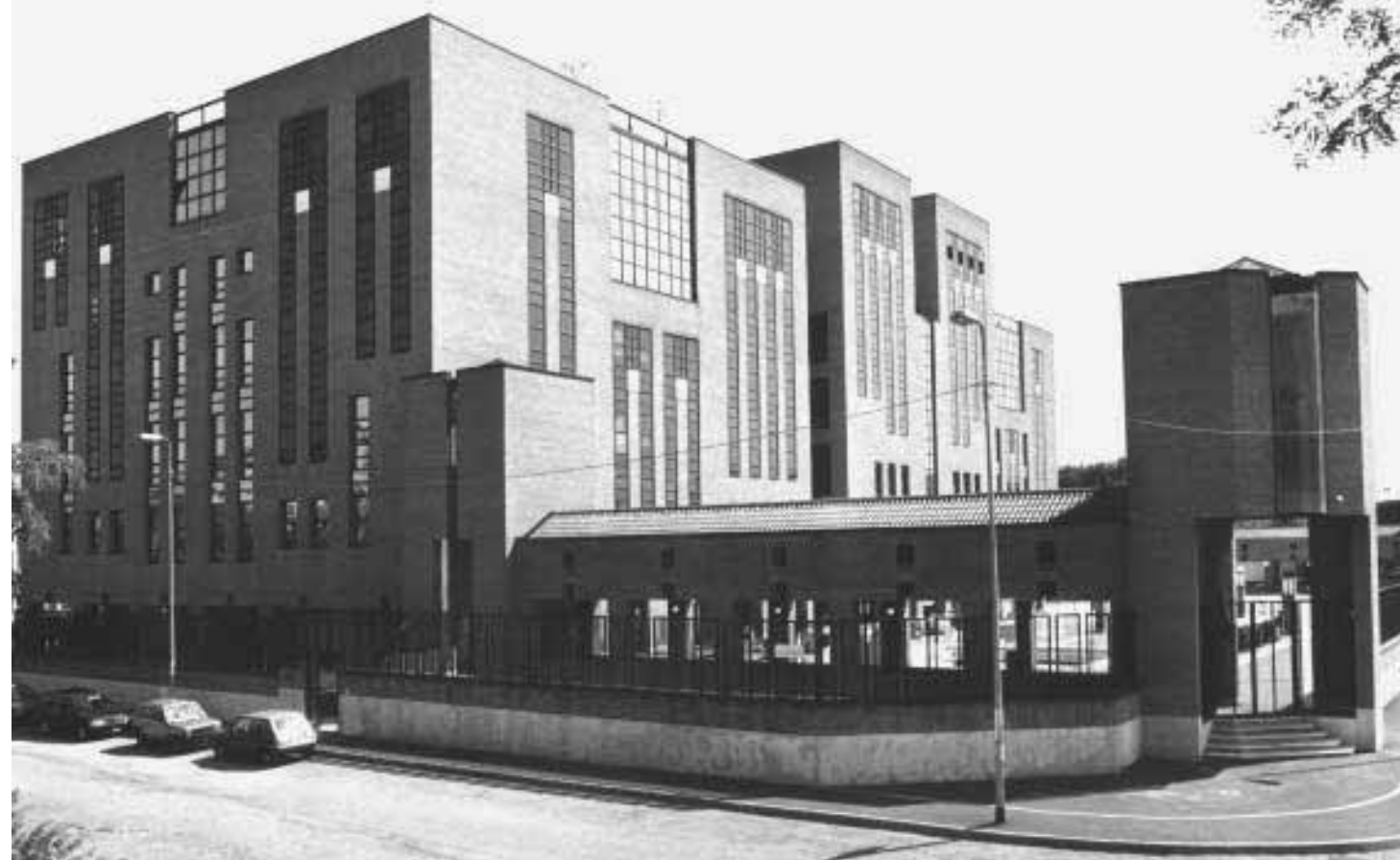
La sede dello Iulm