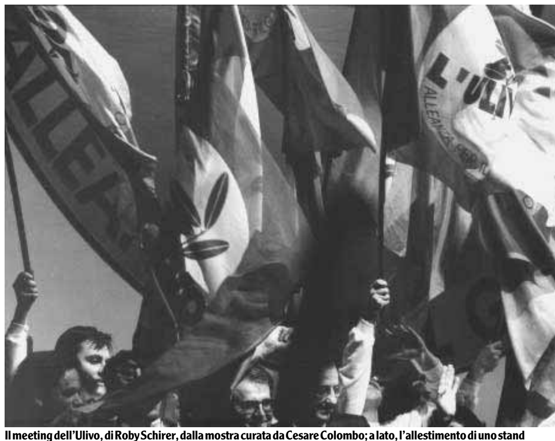
Il meeting dell'Ulivo, di Roby Schirer, dalla mostra curata da Cesare Colombo; a lato, l'allestimento di uno stand

Alla Festa dell'Unità quest'anno grande ritorno delle mostre. Dal 29 agosto al 16 settembre un ventaglio di rassegne dedicate a teatro, fotografia, arte, tratterà in vari modi il tema del rapporto tra Milano e la cultura.