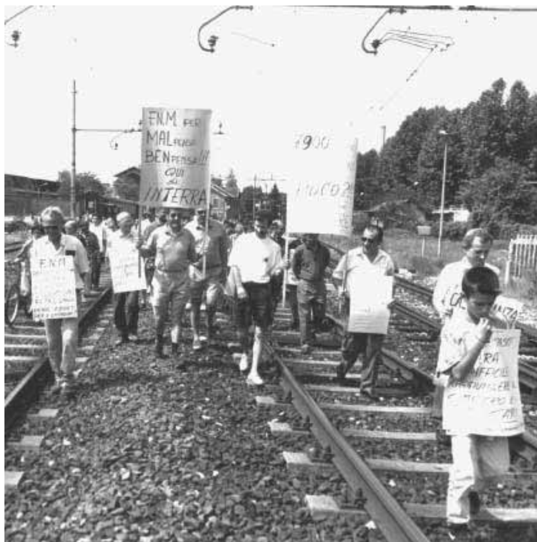
Una manifestazione dei cittadini di Castellanza per l'interramento delle Ferrovie Nord

«Ma mancano valutazioni e stime precise - afferma Perdicaro - e anche chiarito cosa si intende con galleria. Se, come ipotizzato nello studio di massima realizzato da MM in 15 giorni, una galleria artificiale profonda 7,5 metri e che si eleva a mo' di scatola dal livello del terreno di 4 metri o una vera galleria profonda