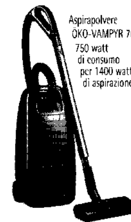
Aspirapolvere ÖKO-VAMPYR 7650 750 watt di consumo per 1400 watt di aspirazione.