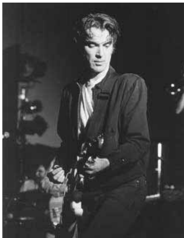
L'ex leader dei Talking Heads, David Byrne, esporrà le sue foto alla manifestazione «Riparte» al Ripa Residence dove espongono 56 gallerie

Nella suggestiva cornice dei porti imperiali di Claudio e Traiano è in scena domani, alle 20.30, il «Balletto di Roma» che presenta in anteprima internazionale lo spettacolo «In Cassandra». La manifestazione, la prima di questo genere in questo luogo ricco di storia, promossa dal Comune di Fiumicino e dalla Banca di Roma si intitola «Approdo ai porti imperiali di Roma». Lo spettacolo d'apertura (informazioni sul programma 84.13.192) sarà preceduto da una visita presso gli scavi archeologici tuttora in via di completamento.