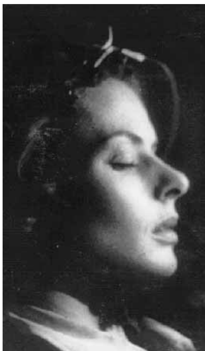
Ingrid Bergman in «Europa '51» in proiezione domani in Campidoglio

Il calendario degli altri appuntamenti prevede: venerdì 13 settembre «Sotto il sole di Roma» (1947) che sarà proiettato alle Mura di Porta S. Giovanni, via Sannio; mercoledì 18 «Nell'anno del Signore» (1969) in via Portico d'Ottavia; sabato 21 «Dramma della gelosia» di Ettore Scialoja (1969) ai Mercati Generali/via Ostiense; domenica 22 «Gli innamorati» di Mauro Bolognini (1956) in via della Pace; venerdì 27 «L'eclisse» di Michelangelo Antonioni (1961) in piazza di Pietra; domenica 29 settembre ultimo appuntamento nel Cortile d'onore del palazzo di Giustizia/piazza dei tribunali con «Il processo» (1962). L'ingresso è gratuito, info 68.80.70.05.