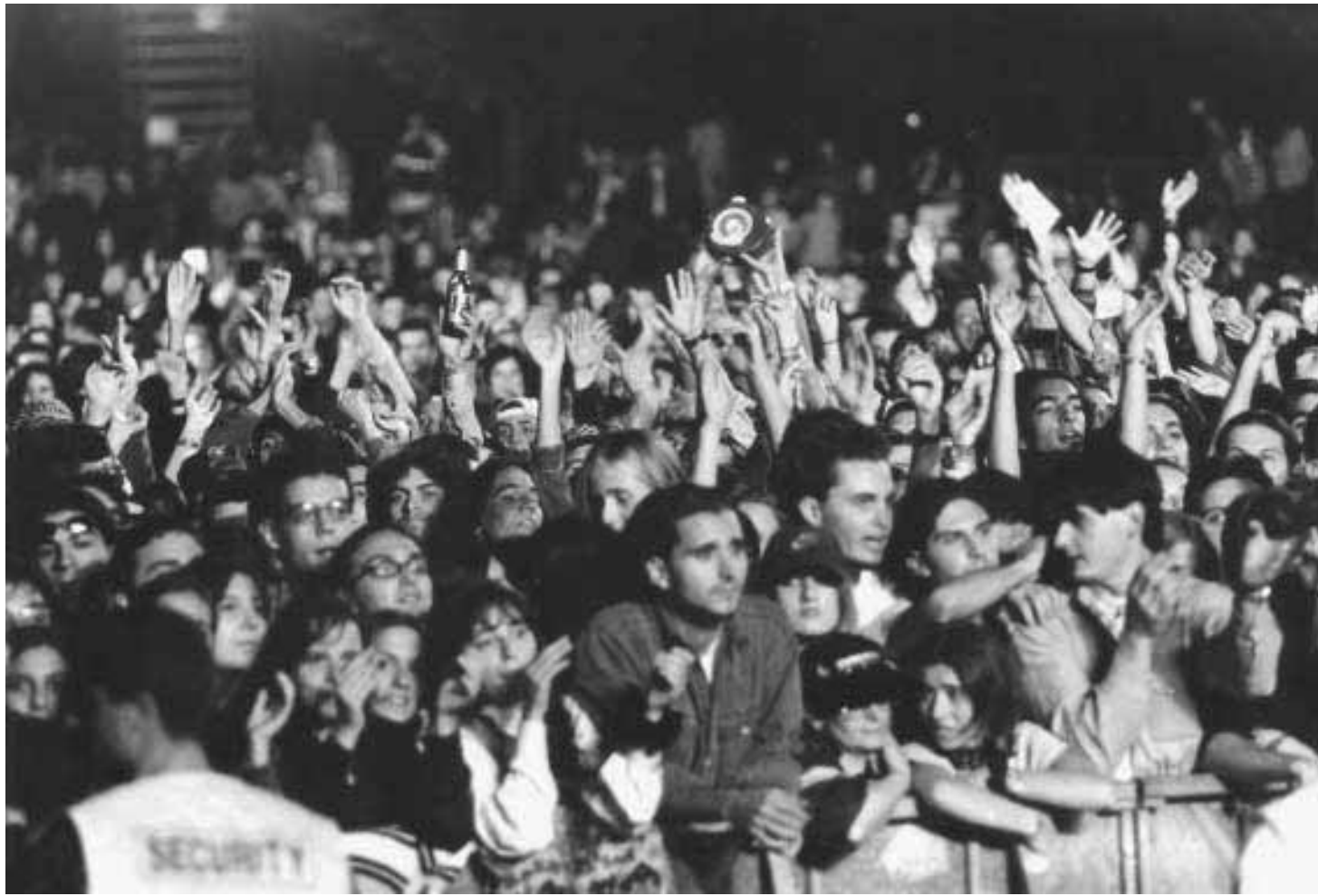
Grande folla al Parco Sempione, ierisera, per il concerto rock «Clio Rds Live 2»