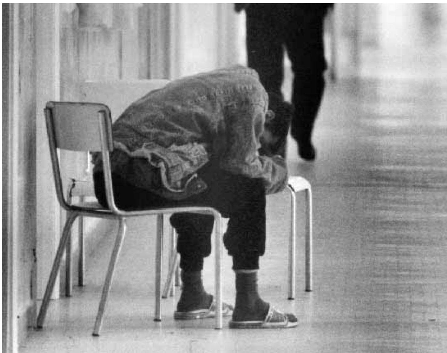
Un ricoverato di un reparto per i malati di Aids