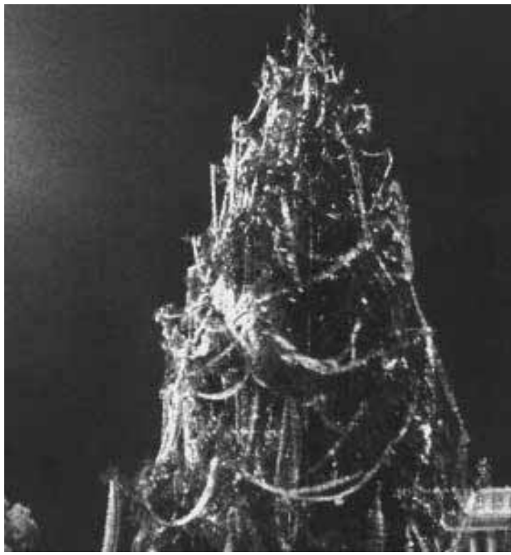
L'albero di Natale a Piazza Venezia. Accanto, le rovine di Veio

Infatti se si vanno ad analizzare le cifre si scopre che il 50% del budget sarà destinato alle attività permanenti, mentre il 6% sarà speso per l'Estate romana e, se si sommano le altre manifestazioni culturali, la percentuale arriva fino al 14%. Riguardo allo sport, l'assessorato per il '97 intende promuovere