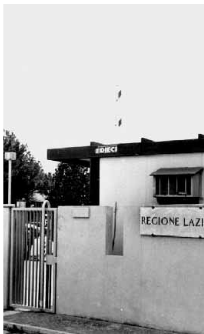
La sede della Regione Lazio