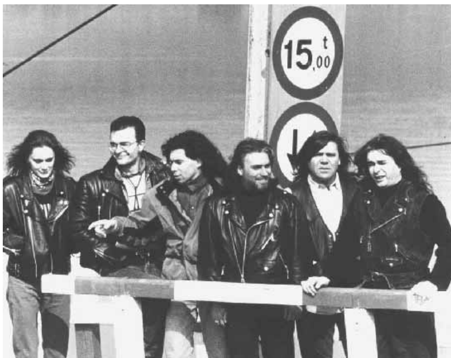
Stasera alla Fiera di Milano ritornano i Nomadi nell'ambito della manifestazione «Natale in Fiera»

I meneghini che amano la fotografia e desiderano ammirare la ricchezza del patrimonio architettonico e ambientale del territorio in cui vivono, non possono lasciarsi sfuggire la mostra «Archivio dello Spazio 4 - Cinquecento fotografie di autori contemporanei sul territorio di 40 Comuni del Milanese» che, sino al 12 gennaio 1997, è possibile visitare al Palazzo della Triennale, in viale Alemagna 6. I cinquecento scatti che compongono la rassegna sono stati firmati da ben 28 fotografi, i quali hanno fornito una personale interpretazione delle zone del Parco del Ticino su cui hanno puntato gli obiettivi. È un esempio di lavoro artistico e di impegno civile, un tentativo di sensibilizzare il pubblico rispetto all'esigenza di conservare e valorizzare il patrimonio artistico e ambientale dell'area milanese. La mostra è promossa dall'Assessorato alla Cultura della Provincia ed è curata da Achille Sacconi con la collaborazione di Roberta Valtorta.