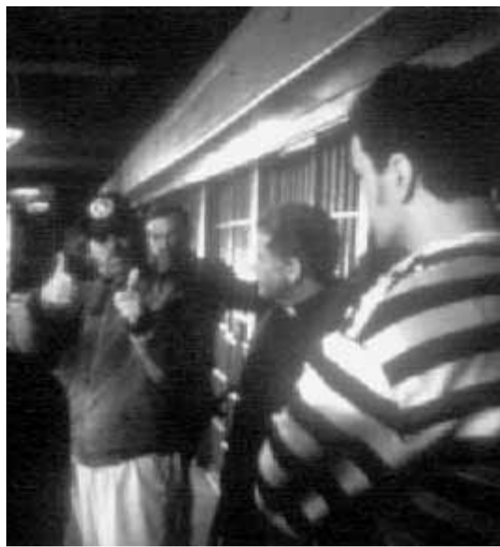
Un'immagine del Cd Rom di Spielberg

nato come il nostro -, ricompare la giovane virago che vi dice: «Grande! Tutta Hollywood ha letto la vostra sceneggiatura e aspetta con ansia il film!». Seguendo le sue autoritarie indicazioni (c'è un fondo sado-maso, in tutta la faccenda, difficile da rimuovere: anche gli sceneggiatori vi trattano malissimo, e ogni tanto vi sottono), entrate nello studio 17, dove conoscerete i vari membri della troupe e gli attori. Qui, una sorpresa: Jack Cavallo è interpretato per voi da Quentin Tarantino, perennemente vestito col camiciotto a strisce. Se