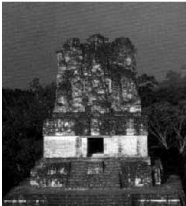
Le gigantesche piramidi della città maya di Tikal spuntano dalla folta giungla del Guatemala

viaggi individuali e di gruppo in Italia e all'estero crociere e soggiorni al mare e ai monti notizie e curiosità dove, quando e a quanto