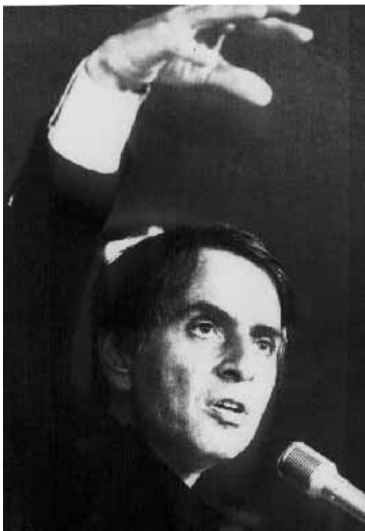
L'astronomo Carl Sagan negli anni 80

Brutte notizie per gli appassionati del whisky. Da uno studio condotto nell'università di Maastricht e pubblicato in una lettera a «Lancet» nel numero del 21-28 dicembre, risulta infatti che il whisky contiene idrocarburi policiclici aromatici. Queste sostanze sono note da tempo come cancerogene anche se, nel caso del whisky, non sono probabilmente l'unico elemento di rischio. Ma c'è di più. I ricercatori olandesi, guidati da Jos Kleinjans, raccomandano cautela anche con grigliate e salmone affumicato. Dai loro studi risulta infatti che alte concentrazioni delle stesse sostanze si trovano anche nelle zone bruciate dei cibi cotti alla griglia e negli alimenti affumicati, oltre che nel fumo di tabacco. Gli idrocarburi policiclici insaturi contenuti nel whisky avrebbero origine dal fumo utilizzato per essiccare l'orzo. Nella ricerca sono state analizzate 18 marche di whisky ed i risultati (in equivalenti di benzopirene, un idrocarburo policiclico aromatico) hanno assegnato il primato negativo a una marca di whisky scozzese di malto (con 47,5 equivalenti di benzopirene).