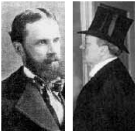
William James e Henry James

diurna divinità. E le sirene, adescatrici del solleone, come testimonia il fatto che la cera che Ulisse taglia per turare le orecchie ai compagni manca poco si liquefaccia per il gran caldo. A questo punto la domanda: come mai l'orrore diurno nel corso dei secoli è diventato notturno? La trasformazione può essere messa in rapporto con l'avvento del cristianesimo e lo stabilirsi di una corrispondenza Luce/Bene e Tenebra/Male, e perciò anche Mezzogiorno/Gaiezza, Mezzanotte/Angoscia. In tal modo, se il demone pagano aveva preferito apparire sotto il sole, il demone monoteista aveva dovuto scegliere di acquartarsi nell'ombra. Ma forse possiamo anche ipotizzare che solo dopo l'invenzione dell'orologio la