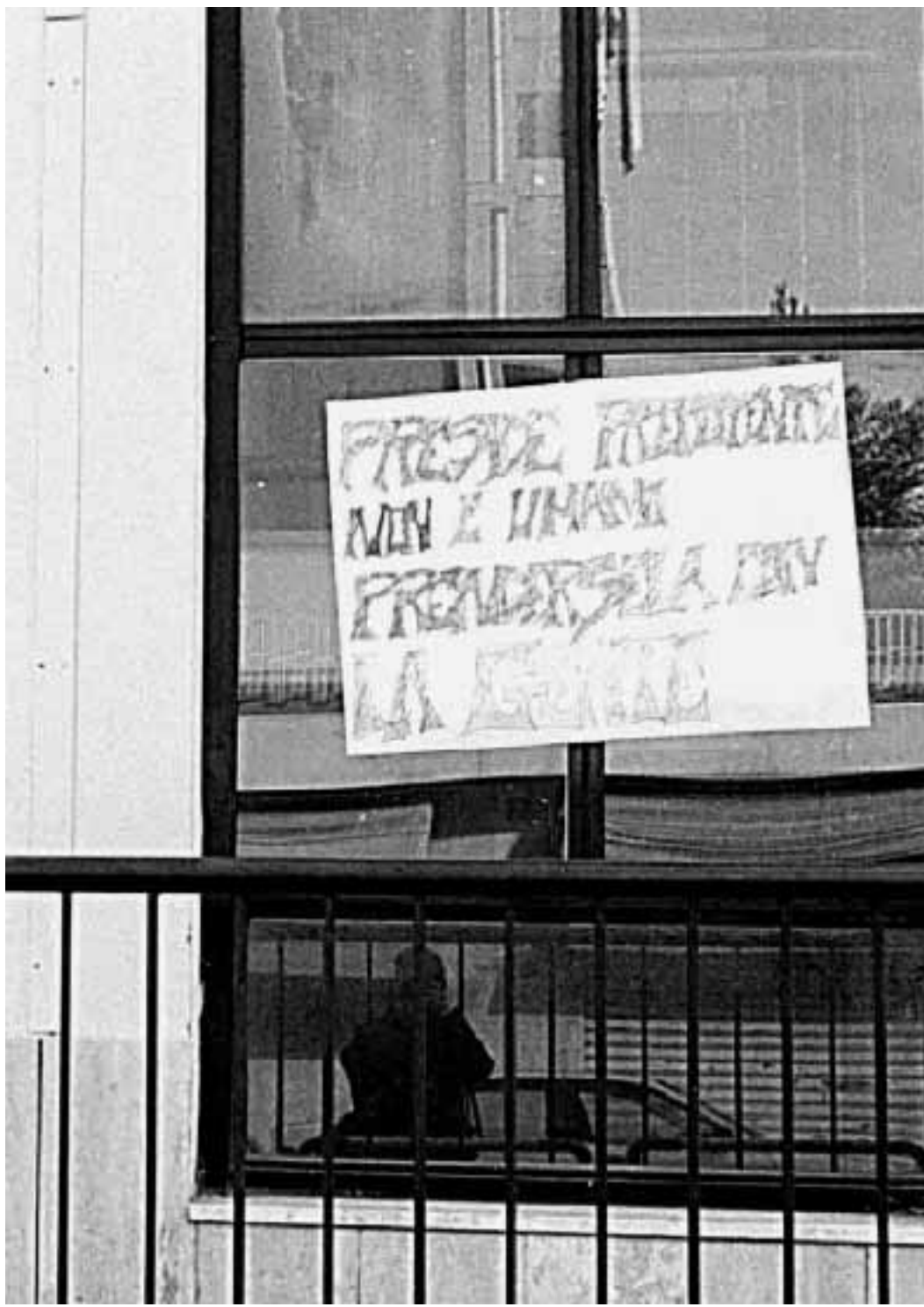
La protesta davanti all'Istituto tecnico commerciale «Tommaso Fiore» di Grumo Appula.

La denuncia Dopo la denuncia del padre della ragazza, sono state invece avviate le indagini dei carabinieri di Grumo, che ieri mattina hanno ascoltato le testimonianze di ragazzi e di professori presenti al momento del fatto. Sempre in mattinata, gli studenti dell'Iic hanno tenuto un'assemblea di noia ai cancelli della scuola e poi, in corteo, si sono diretti in ospedale per far visita alla loro compagna. Contemporaneamente si è tenuta anche una riunione dei professori. Al termine sono stati approvati due