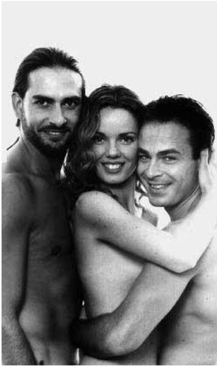
I protagonisti di «Amici per gioco, amici per sesso»

Il pubblico, comunque, si diverte. Ride a ogni battuta. Approva incondizionatamente uno spettacolo a luci rosa, che tuttavia non è l'u-