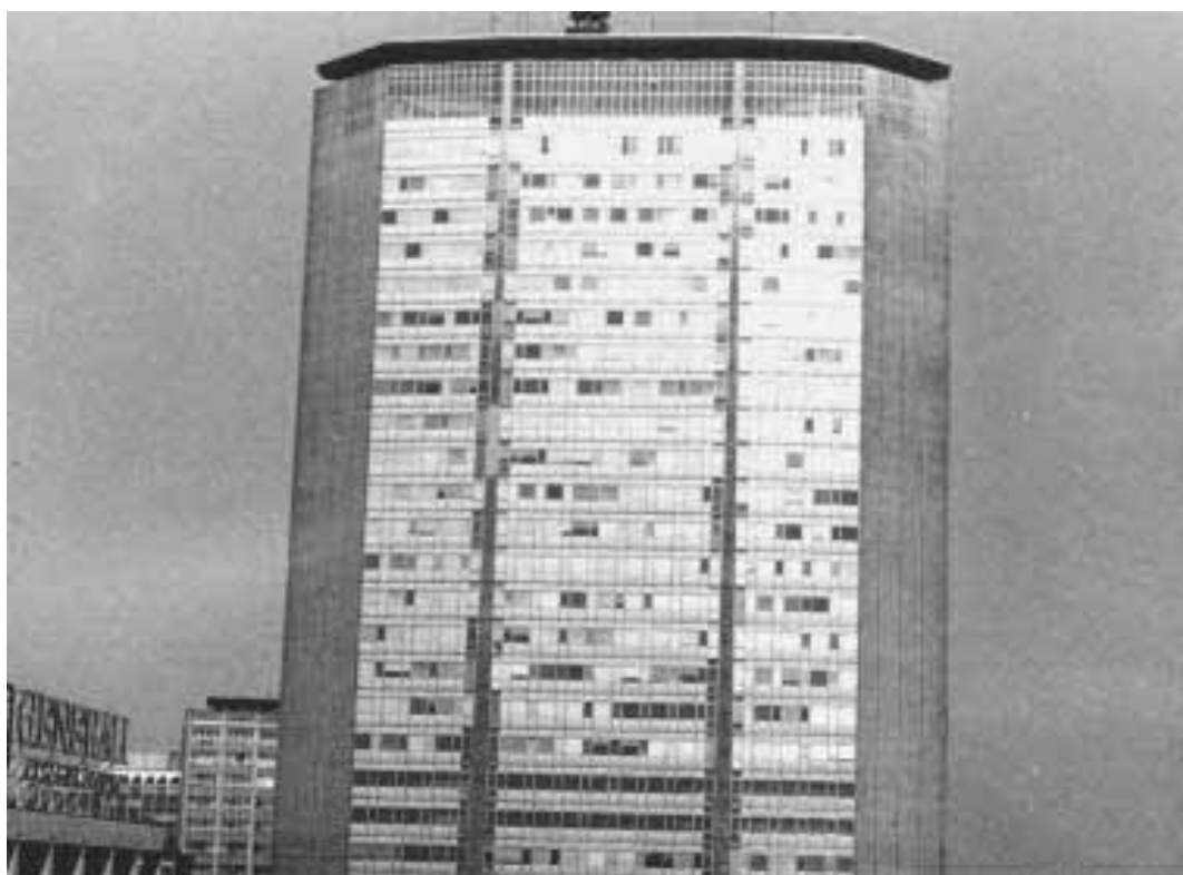
Al Pirellone raffica di nuove consulenze