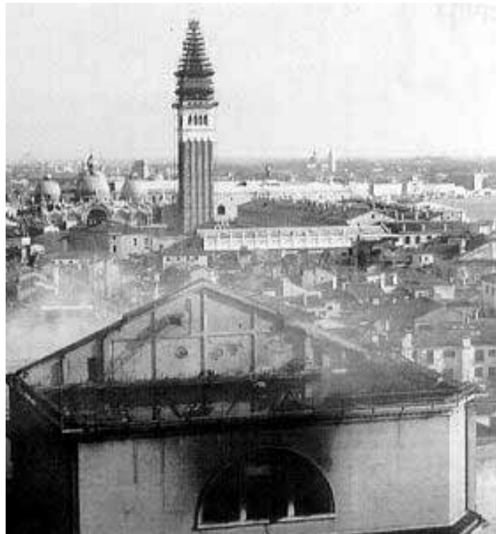
Il teatro La Fenice distrutto da un incendio.