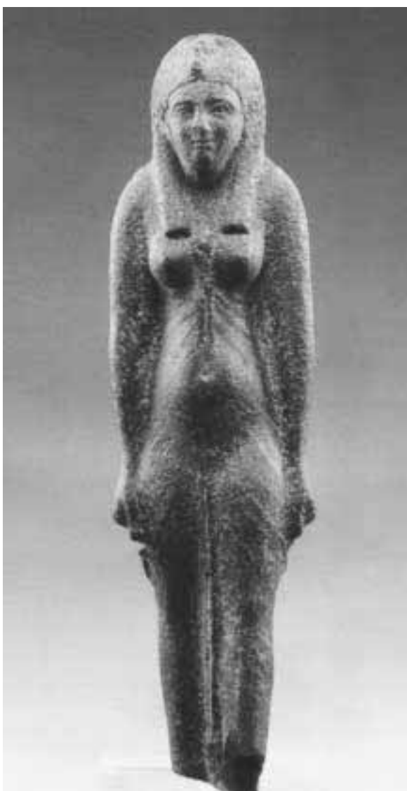
Statua di Iside, I sec. a. C.

Il catalogo, grande formato, 725 pagine, riccamente illustrato, edito dalla Electa, costa 80.000 lire. La mostra è organizzata dalla Regione Lombardia, dal Comune e da Elemond. Per l'occasione, all'interno, è in funzione una caffetteria. Al book shop, innumerevoli gadget ispirati alla mostra.