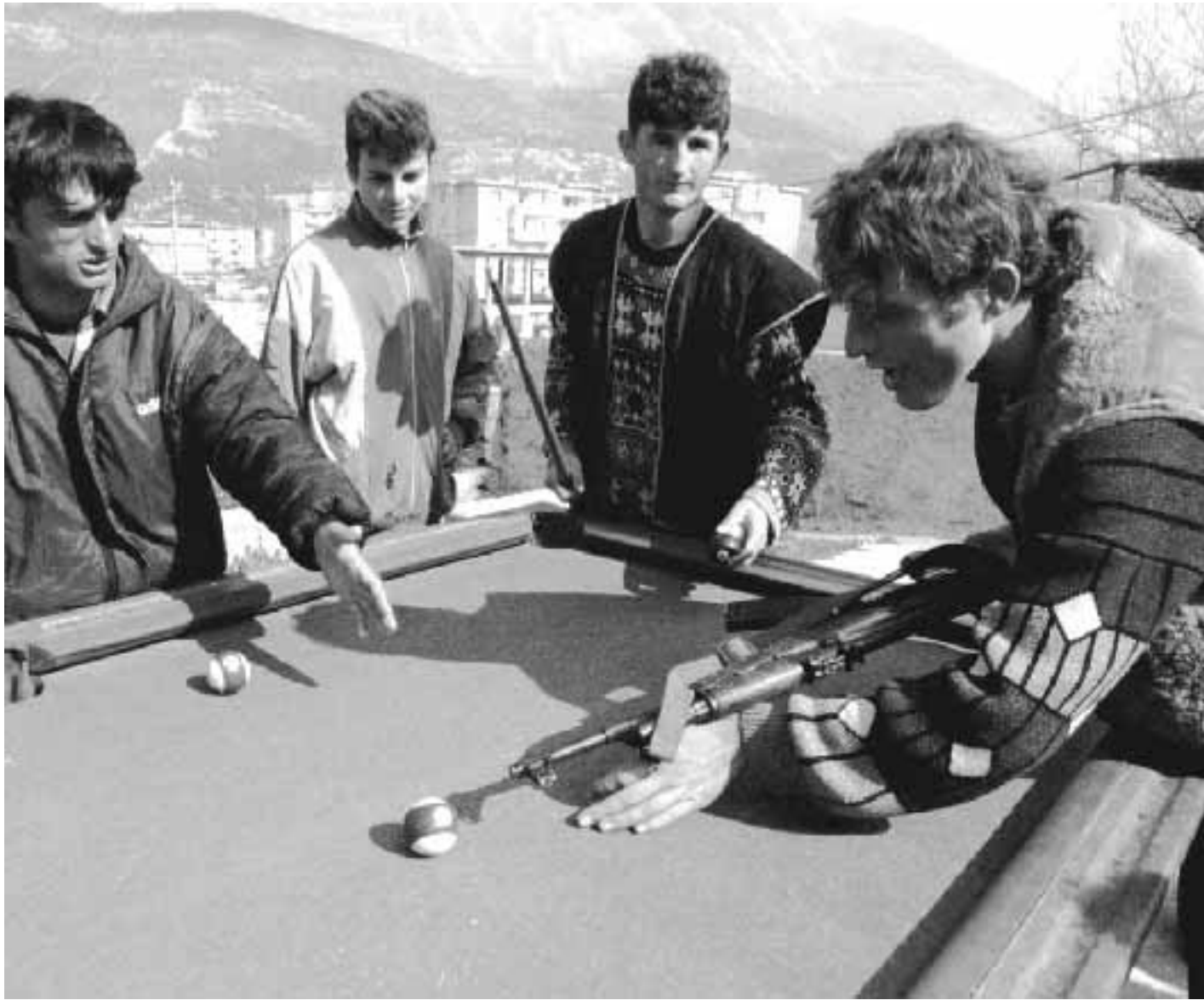
Ribelli albanesi giocano a biliardo con le canne dei loro fucili