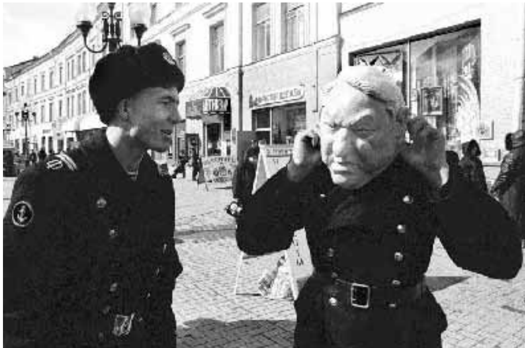
Un marinaio indossa una maschera di Boris Eltsin, in occasione del primo aprile

Scherzi d'ogni tipo nel mondo. Panico in Bulgaria, dove la radio annuncia la chiusura delle banche. A Budapest, «nasce» un dinosauro.