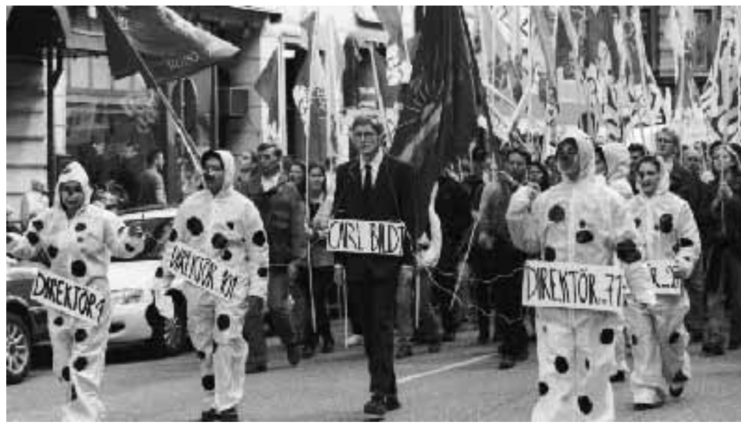
Manifestanti vestiti da «managers dalmati» protestano contro Carl Bildt, leader del partito conservatore svedese e rappresentante europeo in Bosnia.

senza particolare entusiasmo - la proposta avanzata a Bologna dal presidente del Consiglio, Prodi, di dar vita ad una «authority» che sovrintenda la cosiddetta nuova occupazione.