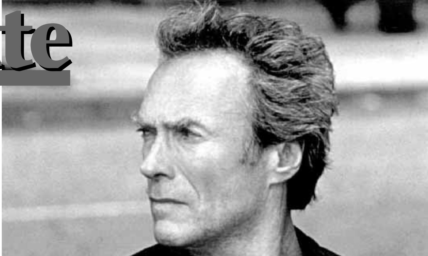
Clint Eastwood, protagonista e regista di «Absolute Power», sotto Gene Hackman e Laura Linney

sarà la sua unica arma per ricattare la Casa Bianca, smascherare gli assassini e tentare di salvarsi la pelle: cercando di non coinvolgere la figlia Kate, che disprezza il suo «lavoro», non lo frequenta da anni, ma che lui ama teneramente. Invece la polizia, che indaga sul caso ma non è per nulla convinta della colpevolezza di Whitney, userà proprio Kate per arrivare a lui e farlo parlare. Inutile dire che, al contrario, la Casa Bianca ha tutto l'interesse ad abbattere Whitney prima che possa dire «bah»: su questo conflitto d'interessi si gioca la seconda metà del film, sulla quale è d'obbligo il silenzio. A meno che abbiate già letto il romanzo: ma anche in questo caso sappiate che il finale è totalmente diverso. Il libro Potere assoluto ha una sto-