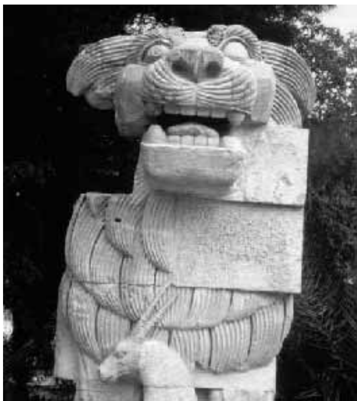
Siria. L'ingresso al Museo Archeologico di Aleppo: scultura arcaica proveniente da Ain Dara

viaggi individuali e di gruppo in Italia e all'estero crociere e soggiorni al mare e ai monti notizie e curiosità dove, quando e a quanto