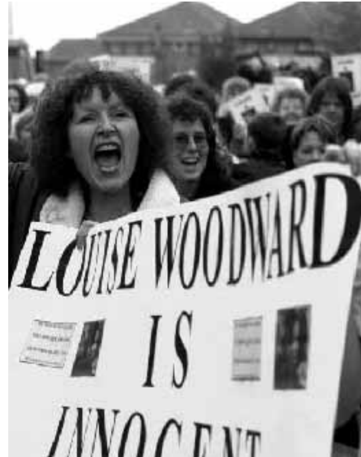
Manifestazione a Elton a favore di Louise Woodward

Le opzioni del giudice sono piuttosto definite, e vanno dalla cancellazione del verdetto, alla riduzione della pena, e la convocazione di un altro processo. Secondo le previsioni degli esperti legali, la scelta più probabile sarà quella della riduzione della pena, considerata troppo severa per una giovane donna come Louise Woodward. Altrimenti c'è sempre l'appello, ma nel caso di un fallimento di tutti i tentativi, la diciannovenne inglese dovrà passare almeno 15 anni in un carcere americano, prima di essere eleggibile per la libertà anticipata.