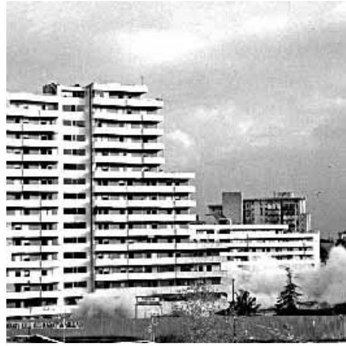
Il tentativo di abbattimento andato a vuoto

Alle 14,16, fallito il primo tentativo di demolire la «vela» F (una delle sette progettate all'inizio degli Anni Settanta dall'architetto Franz Di Salvo), c'è stata una breve protesta di alcuni inquilini degli altri sei casermoni, costretti a rimanere ancora per molte ore nella sala attrezzata nella Circostrazione, dove sono stati sistemati anche gli ammalati e i portatori