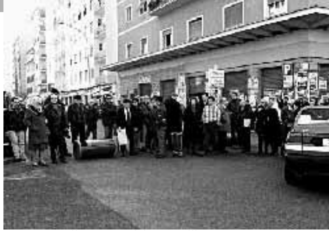
La protesta alla stazione del metrò all'Anagnina a Roma.