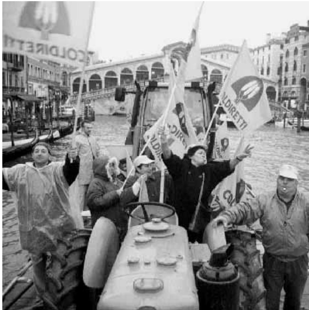
Il corteo di barche della Coldiretti ieri sul Canal Grande a Venezia

va insieme a 2 mila sacchetti di riso e 200 galline, il tutto accompagnato dai cori delle mondine. I romani hanno invece gustato 3 mila spiedini, con contorno di 15 quintali di carote e 3 quintali tra pane e olio. Una stalla con vacche e vitelli ha ospitato, a Firenze, la distribuzione di 10 mila confezioni. La riviera dei fiori si è fatta sentire, a Imperia, con 5 mila rose. Le dieci barche che dato vita a Venezia all'agri-regata avevano stivato 5 ettolitri di vino, e 10 forme di Montasio. Omaggio apprezzato anche dal sindaco Massimo Cacciari che ha promesso il suo appoggio, mentre i vertici della Regione si sono impegnati ad affrontare subito la questione agricoltura. Il vino è stato versato «a fiumi» anche a Udine e a Asti dove si è preferito offrire bottiglie mezza vuote per ricordare che si stava pur sempre protestando. Più igienisti a Torino, dove si è brindato con i tassisti dell'aeroporto con 4 mila confezioni di latte. Mele e pere sono partite dalle Marche attraverso i caselli autostradali, e tutto il Mezzogiorno si è mobilitato facendo assaggiare i suoi prodotti più appetitosi.