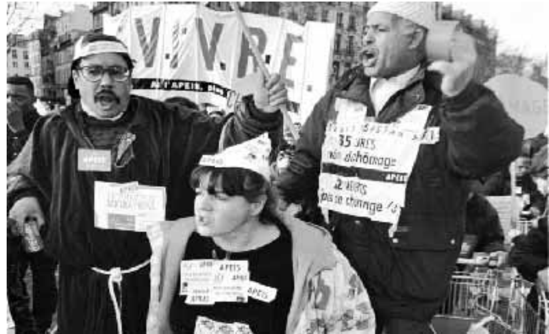
Una manifestazione di disoccupati francesi a Parigi