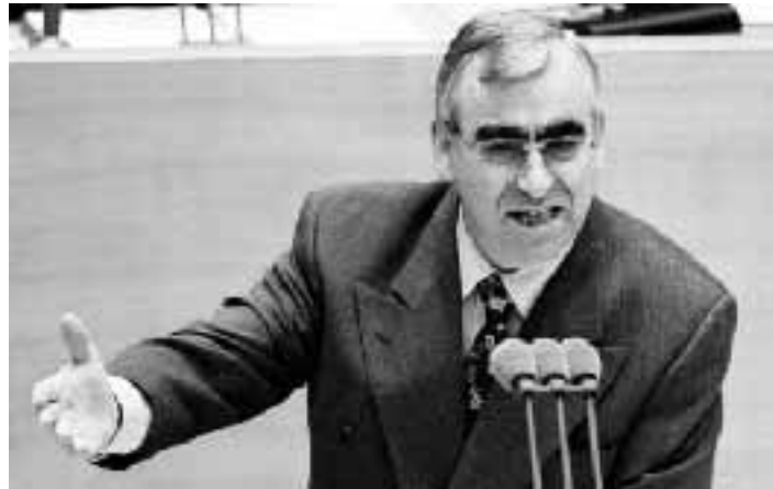
Il ministro tedesco Theo Waigel

Il viaggio è stato programmato da alcune settimane, ma dopo le ultime polemiche sui conti italiani il suo interesse è raddoppiato. L'Italia si trova in un fuoco incrociato. Da un lato è