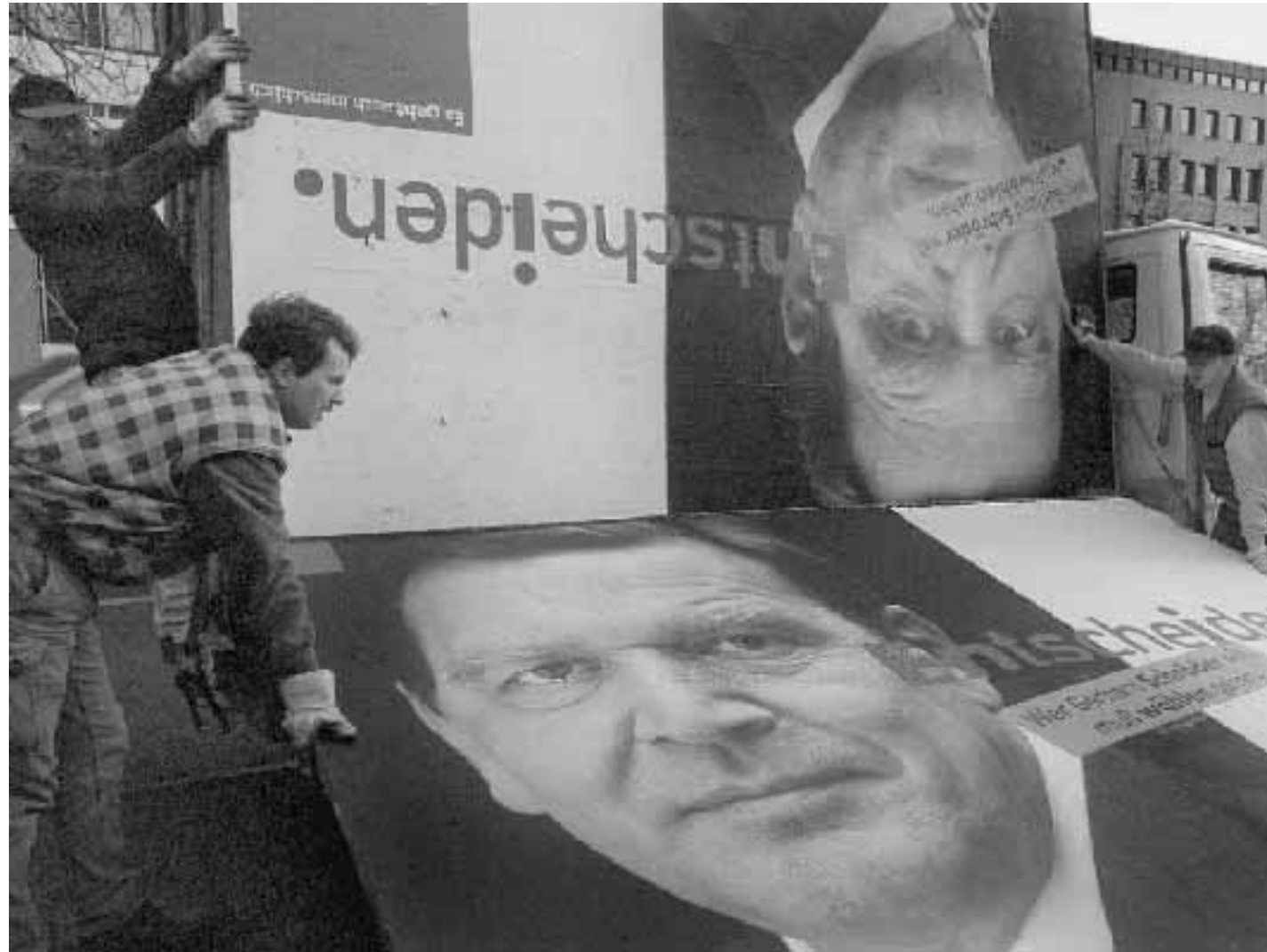
Operai smantellano i cartelloni pubblicitari della campagna elettorale in Bassa Sassonia in alto Gerhard Schroeder

Quanto alle future alleanze di governo, è duttile Schröder: «Assieme ai verdi abbiamo le migliori possibilità di mandare il cancelliere a godersi la meritata pensione», ironizza. Ma non è certo l'unica alternativa possibile. Se l'alleanza rosso-verde non dovesse funzionare, non ci sarebbe niente di catastrofico, spiega, in un governo di grande coalizione con i cristiano-democratici. Schröder ha detto poi che non intende portare avanti una campana «ideologizzata». «Non è solo con la somma dei voti della Spd e dei verdi che si può vincere. Io intendo rivolgermi al centro, perché al centro che si vince», ha aggiunto, ricordando Willy Brandt, che soleva dire che «in una moderna democrazia chi non occupa il centro non otterrà mai la maggioranza». Un'idea che ha voluto ricordare anche nel suo intervento subito dopo la