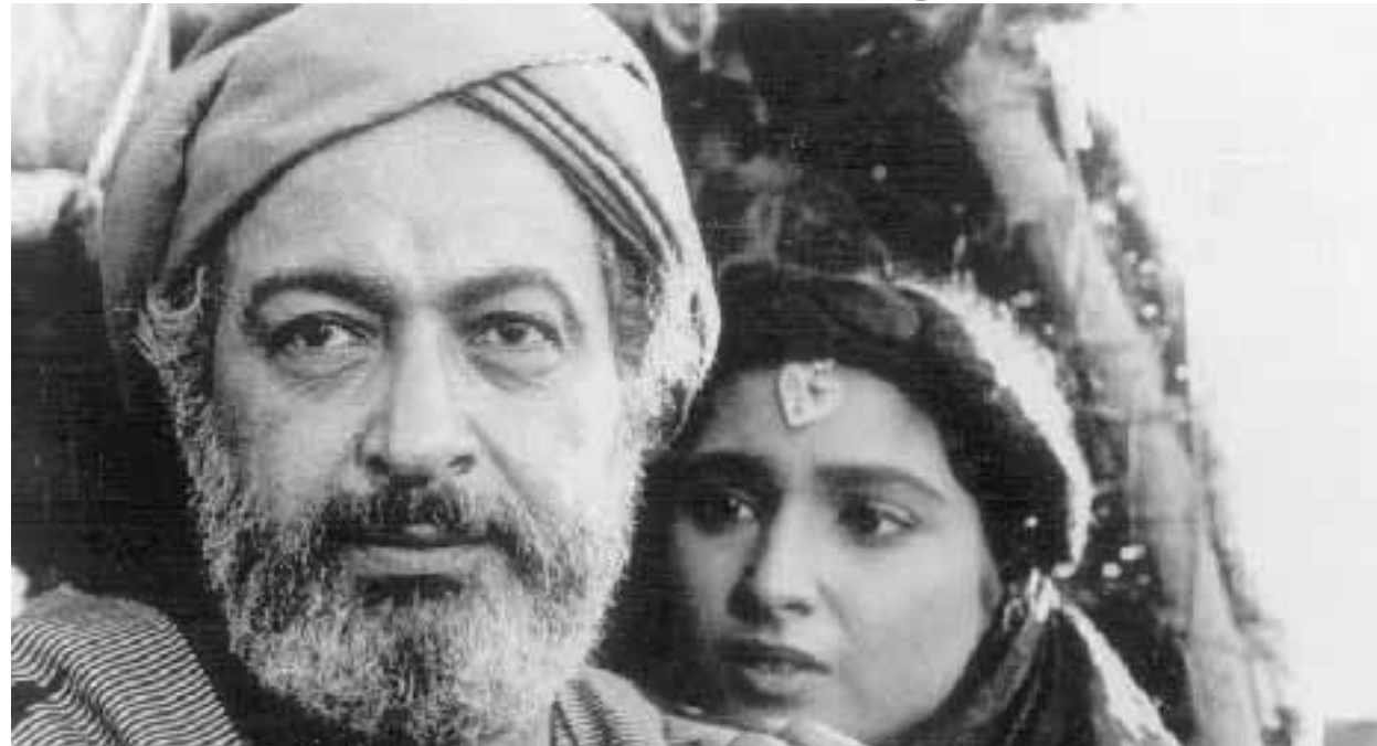
Nour El Chérif in una scena del film diretto da Youssef Chahine, nella foto accanto al titolo

«Avevamo un'industria fiorente, che produceva un centinaio di film l'anno. Ora se ne fanno sei e no dodi-