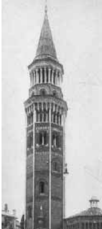
Il campanile di S. Gottardo

Il campanile ottagonale, opera del Pecorari, è uno dei più belli di Milano, sicuramente il più elegante. Nel resto della chiesa, oltre ad una bella tela del Cerano (san Carlo