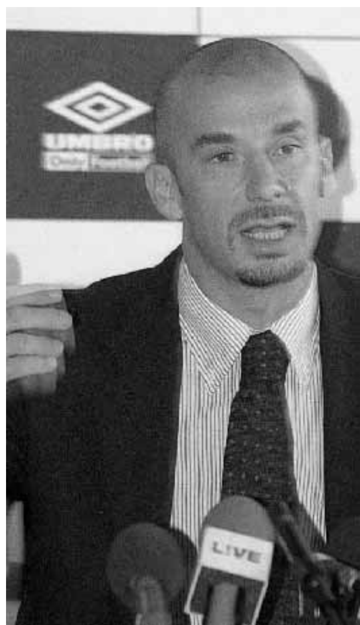
Vialli incontrerà in semifinale il Vicenza