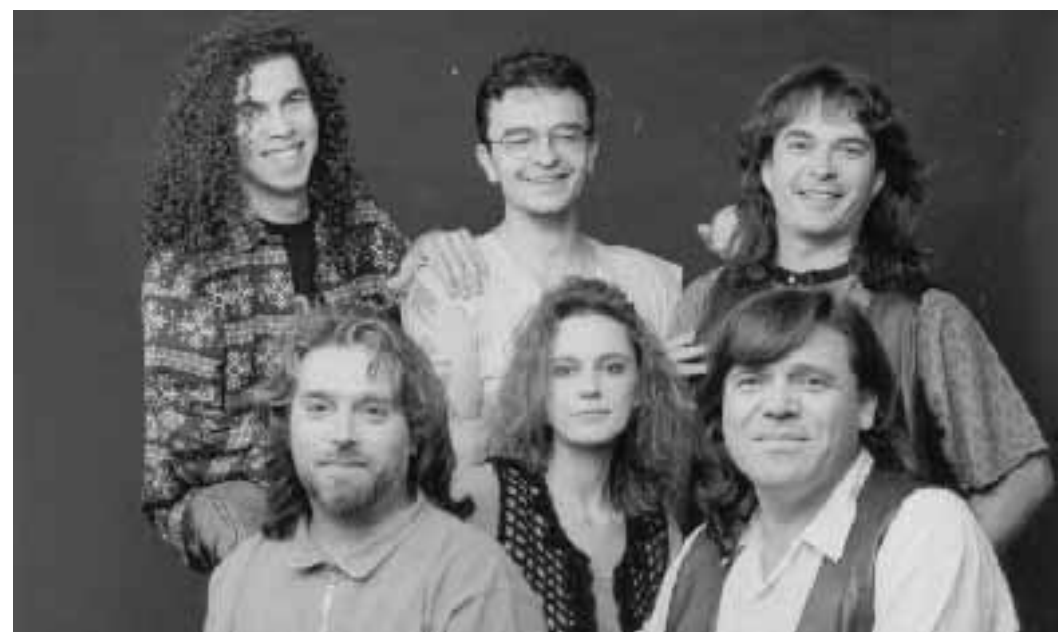
I Nomadi domani sera in concerto al Centro civico di Bresso