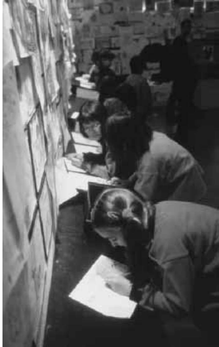
Bambini alla mostra viennese di «Soldi»

ARTE. Sabato prossimo 4 aprile l'associazione culturale Opera d'arte organizza per i bambini una visita alla Basilica di Sant'Ambrogio. Il ritrovo è fissato per le 16 nell'atrio della basilica; il costo è di lire 16.000. È necessario prenotare telefonando al numero 6900.0579.