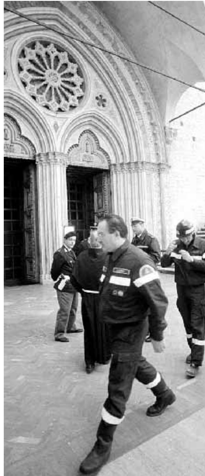
Vigili del fuoco durante i controlli alla Basilica di Assisi