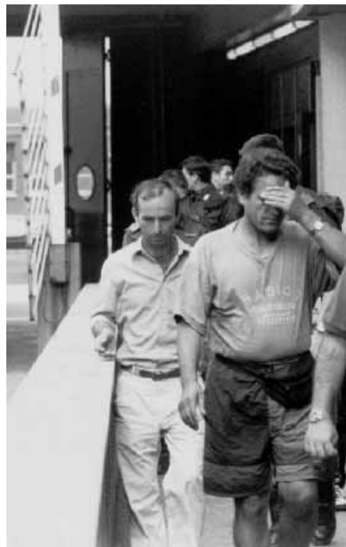
Un'operazione di polizia contro immigrati clandestini

Il Cenacolo vinciano, presso Santa Maria delle Grazie, da martedì prossimo sette aprile sarà aperto anche alla sera per le visite. Oltre al consueto orario, dalle 8 alle 14, il Cenacolo sarà aperto, dal martedì al sabato, anche dalle 19 alle 22, mentre alla domenica sarà aperto anche dalle 17 alle 20. Resta invece confermata la chiusura del lunedì per il turno di riposo. Il nuovo orario rientra nel progetto elaborato e varato dal ministro dei Beni culturali nell'ambito del progetto «Musei il giorno più lungo».