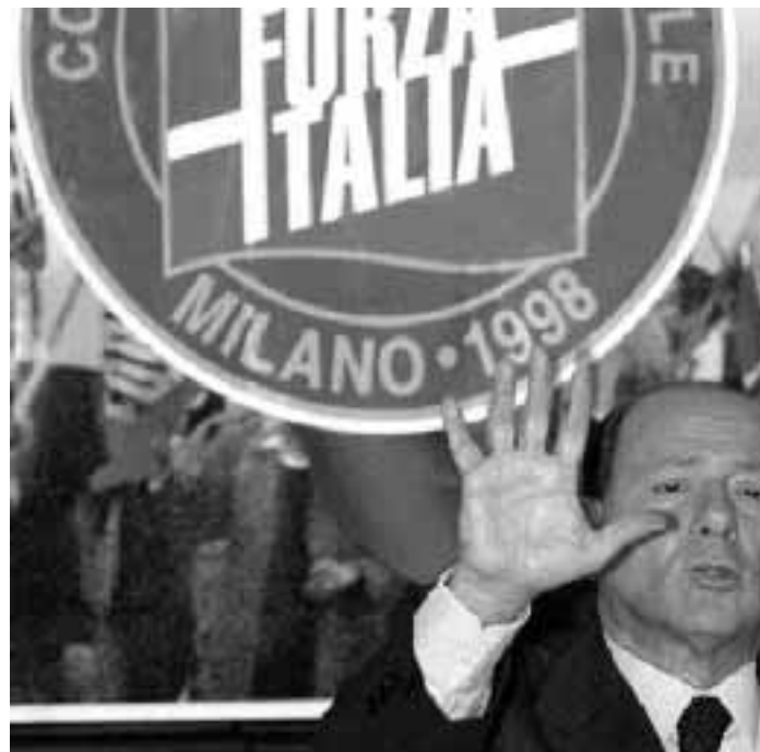
Il leader di Forza Italia Silvio Berlusconi

Parleranno solo gli ospiti stranieri, quelli italiani no. Insomma Fini non potrà «rendere la pariglia» a Berlusconi che al congresso di An fece un discorso molto polemico. Costeranno circa 10 miliardi le assise di «Forza Italia, forza di libertà», che si terranno dal 16 al 18 a Milano e si divideranno in 7 commissioni su: economia, Stato, lavoro, formazione, politica estera, giustizia, federalismo. Al congresso ci arrivano tutti gli eletti (tra cui 11 deputati, 39 senatori, 22 parlamentari europei, 3 presidenti di Regione e 477 sindaci) e i dirigenti come membri di diritto e i delegati dai 117 congressi provinciali: 3.076 persone in tutto. Sabato pomeriggio «un corteo per la libertà» partirà da porta Venezia per giungere a piazza Duomo, dove parlerà Berlusconi.