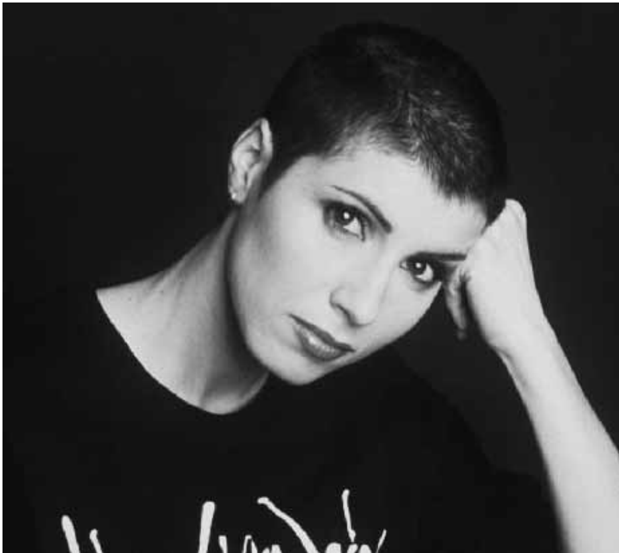
La cantante Giorgia. Sotto, a sinistra, l'architetto Gregotti e a destra, il pianista Canino

Scarna ed essenziale è la scenografia, per centrare l'attenzione sulla musica e le interpretazioni di Giorgia. Che, non contenta del suo repertorio, si cimenta anche in rischiose cover, spaziando da Buckshot Le Fonque a Sting fino all'idolo di sempre: Prince.