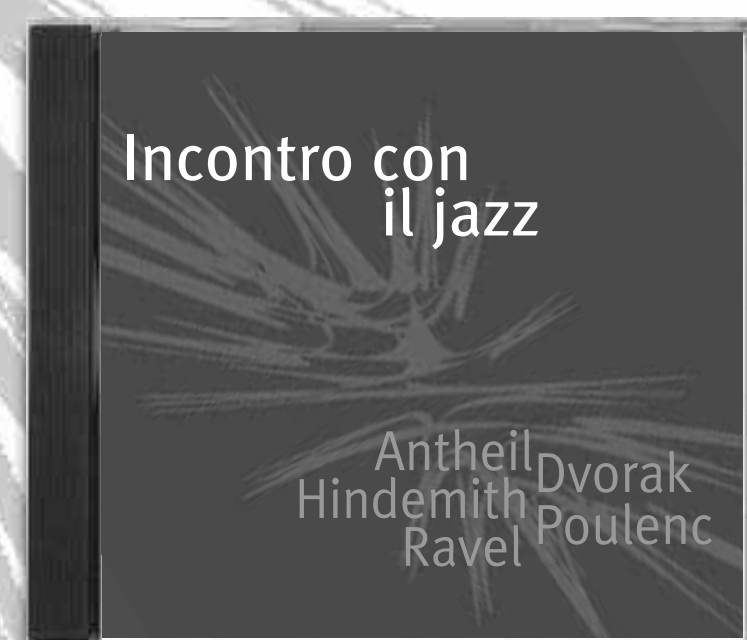
Incontro con il jazz Antheil, Dvorak, Hindemith, Poulenc, Ravel