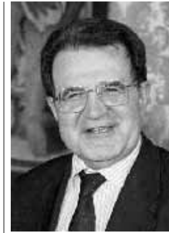
Romano Prodi oggi negli Usa

Il presidente del consiglio Romano Prodi è atteso oggi attorno alle 18 (mezzanotte in Italia) a Washington per una visita ufficiale che, all'indomani della nascita dell'Euro e a meno di due settimane dal «G7-G8» di Birmingham, assume un'importanza particolare. Prodi (che sarà affiancato dal ministro degli esteri Lamberto Dini) sarà il primo capo di governo dell'Europa ad 11 ad essere ricevuto alla Casa Bianca. Non ci sono al momento, nelle relazioni politiche ed economico-commerciali italo-americane, problemi di sorta. Possibile che si parli del caso Baraldini