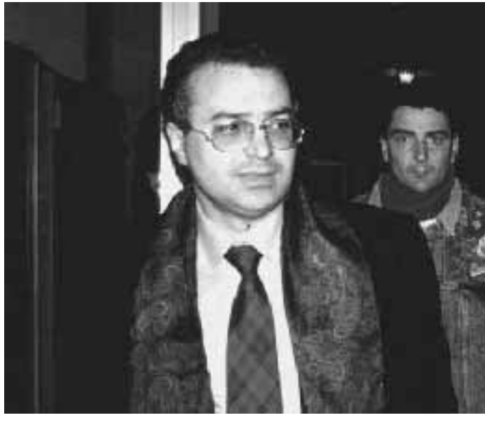
L'ex sottosegretario agli Interni Angelo Giorgianni

determinata principalmente, se non esclusivamente, dalla prospettiva, abbastanza certa, della miliardaria convenzione con l'Università». Ma il Rettore Diego Cuzzocrea ha sempre detto di aver espresso l'intenzione di disfarsi del pacchetto azionario della Sitel dopo la sua elezione. Circostanza smentita dai documenti. La convenzione con l'impresa di famiglia viene prorogata tacitamente per più anni, subendo taciti rinnovi proprio durante la gestione Cuzzocrea. «L'alienazione del pacchetto azionario - scrive l'Antimafia - era sopravvenuta ben oltre la data di insediamento del Rettore e quando la tempesta giudiziaria sulla gestione Sitel era già diventata di dominio pubblico. Il professore Cuzzocrea avrebbe dovuto