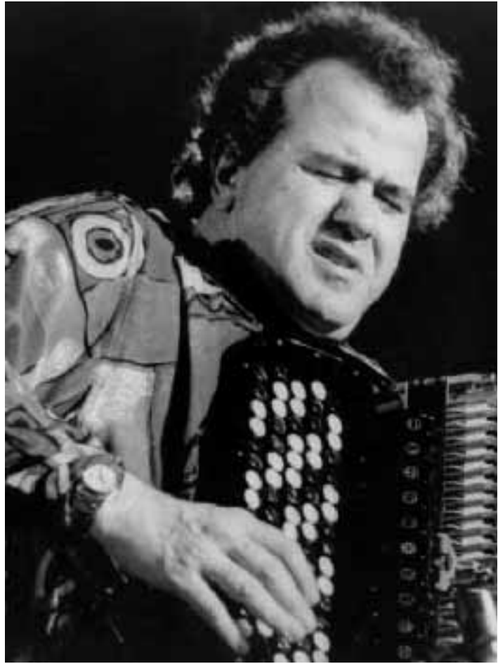
A.R. Richard Galliano