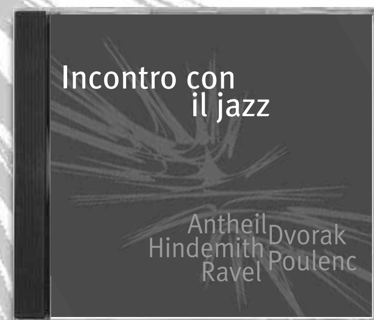
Incontro con il jazz Antheil, Dvorak, Hindemith, Poulenc, Ravel