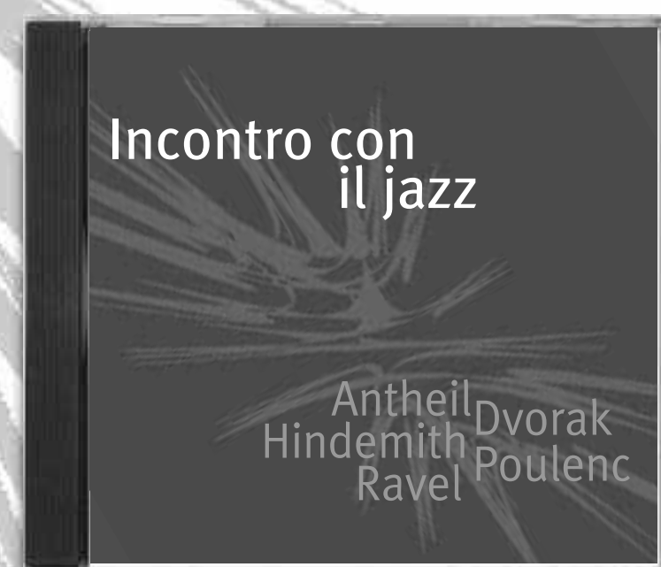
Incontro con il jazz Antheil, Dvorak, Hindemith, Poulenc, Ravel