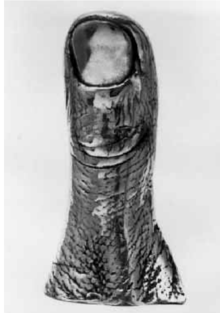
César, «Il pollice innox», 1965

Si inaugura oggi a Palazzo Reale l'ampia mostra antologica dedicata a César, uno dei massimi scultori dell'età contemporanea. La retrospectiva, che resterà aperta sino al prossimo 12 luglio, riunisce 120 opere dell'artista francese di origine toscana provenienti da collezioni private e grandi musei internazionali: dal «Bestiario in ferro saldato» degli anni '50 alle celebri e più recenti «Compressioni», realizzate servendosi di presse meccaniche in cui le automobili, oggetti simbolo del progresso sociale, vengono compresse e ridotte in compatti blocchi parallelepipedi. Sono presenti in mostra anche alcuni esemplari della serie dei «Nudi» e dei «Busti» fino ai cicli dei recenti «Autoritratti» e dei famosissimi «Pollici», uno dei quali in ferro, alto quasi due metri, realizzato nel 1964/65. Orario: martedì-domenica dalle 9.30 alle 18.30, lunedì chiuso. Bbiglietti: intero 10.000 lire, ridotto 5.000 lire, scuole 1.000 lire.